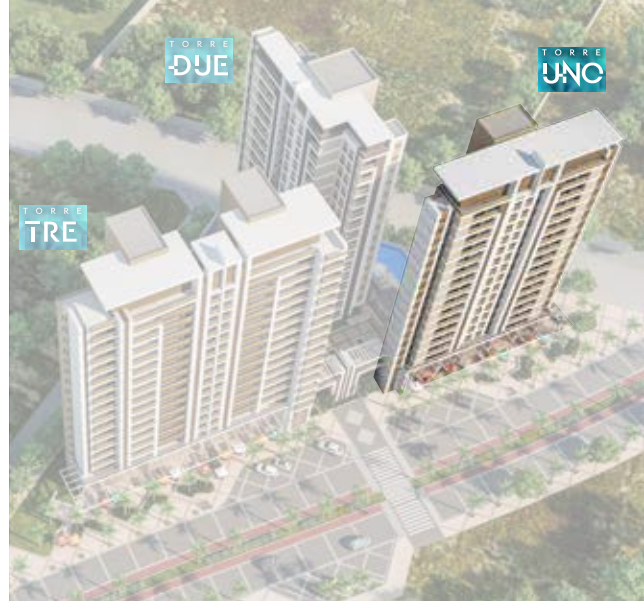
Tabela de disponibilidade setembro/2018 53,5m 2 | Torre UNO