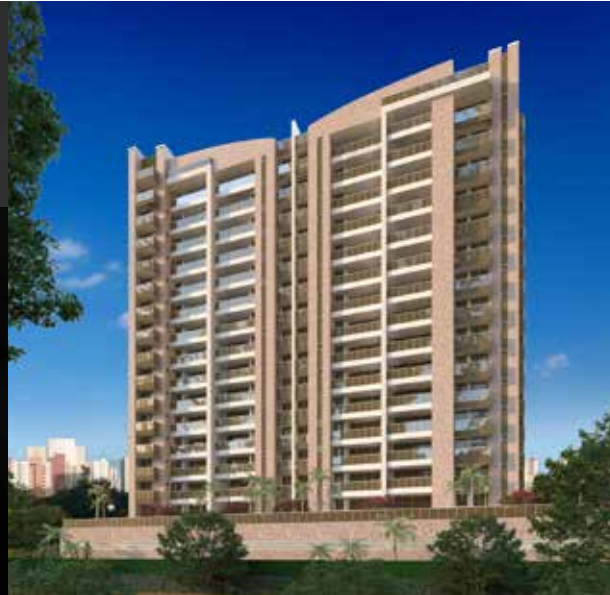
Tabela de disponibilidade janeiro 2022 75m 2 | apartamento tipos A e B