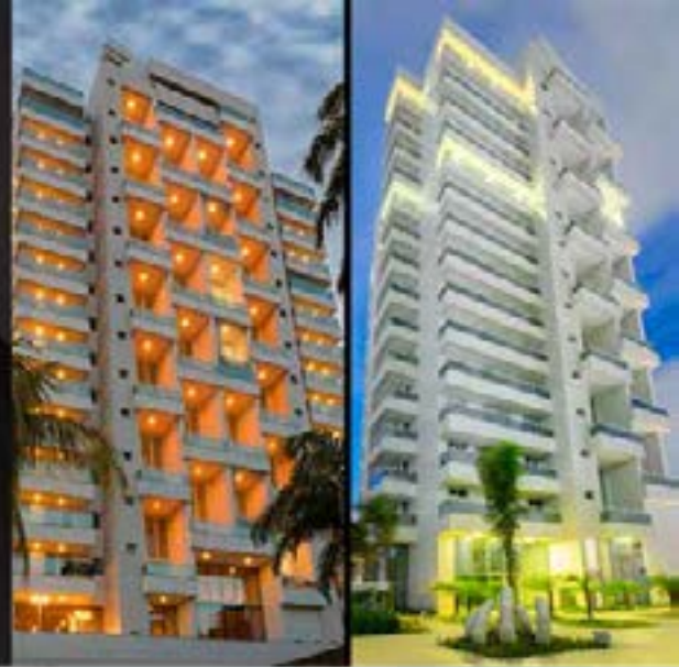
Tabela de disponibilidade julho 2023 90,98m 2 | Colunas 2 e 3