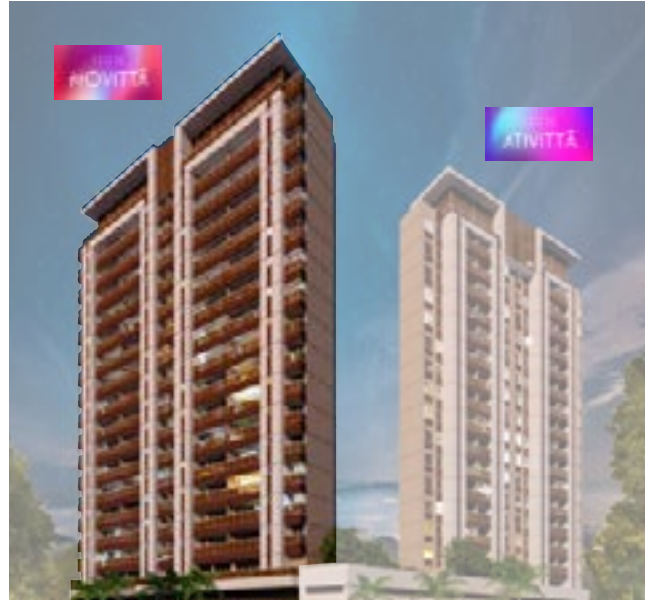
Tabela de disponibilidade abril 2024