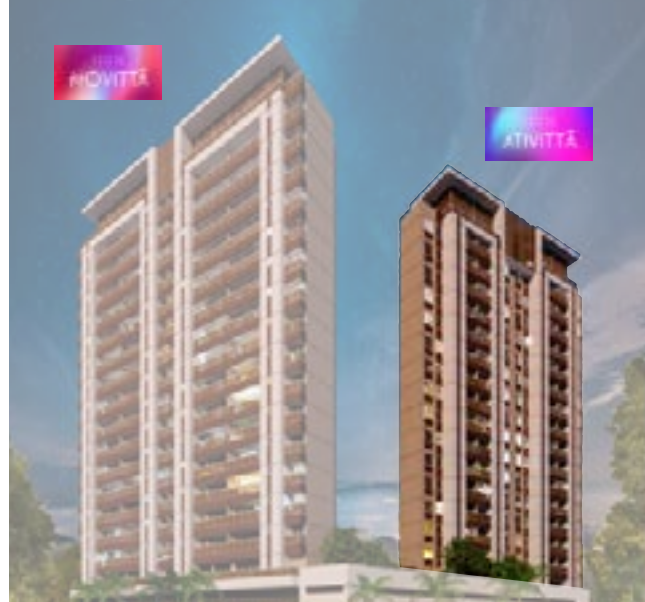
Tabela de disponibilidade abril 2024